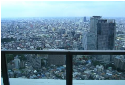
ビューラウンジからの眺望